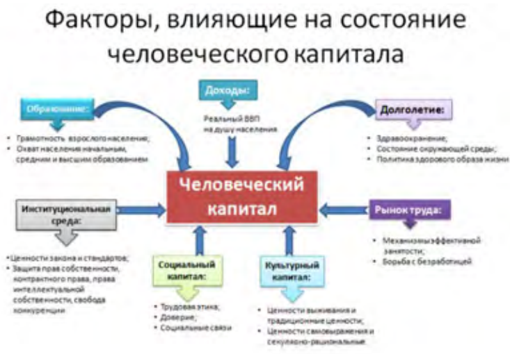
Рис. 1 - Факторы, формирующие человеческий капитал

Таким образом, вовлечение человеческого капитала инвалидов в систему экономических отношений обеспечит