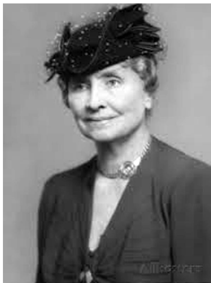
Рис. 1 - Хелен Келлер

В 1898 г. Хелен поступила в Кембриджскую школу для девушек. Окончив ее, получила разрешение на поступление в Колледж Рэдклифф, который закончила с отличием в возрасте 24 лет. Так она стала первым слепоглохим человеком, получившим высшее образование.